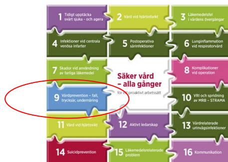
Figur 1: 16 områden inom Säker vård - alla gånger. http://plus.rjl.se/sakervard

Läs mer på webbplatsen http://plus.rjl.se/sakervard .