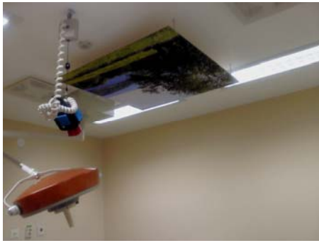
Fotomotiv: Vätterutsikt 100 x 100 cm

Var: Uppsatt i taket i ett behandlingsrum där det utförs mindre kirurgiska ingrepp som tex. borttagande av hudförändringar och patienten är vaken. Det finns ännu ett behandlingsrum med liknande verksamhet där de har fotomotivet Skogsväg 100 x 100 i taket.