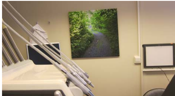
Fotomotiv: Skogsstig 100 x 100 cm

Var: Uppsatt på vägg i ett behandlingsrum och i tak i behandlingsrum ovanför tandläkarstol.