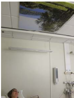
Fotomotiv: Vätterutsikt 100 x 100 cm

Var: Uppsatt i taket i behandlingsrum ovanför en gynstol.