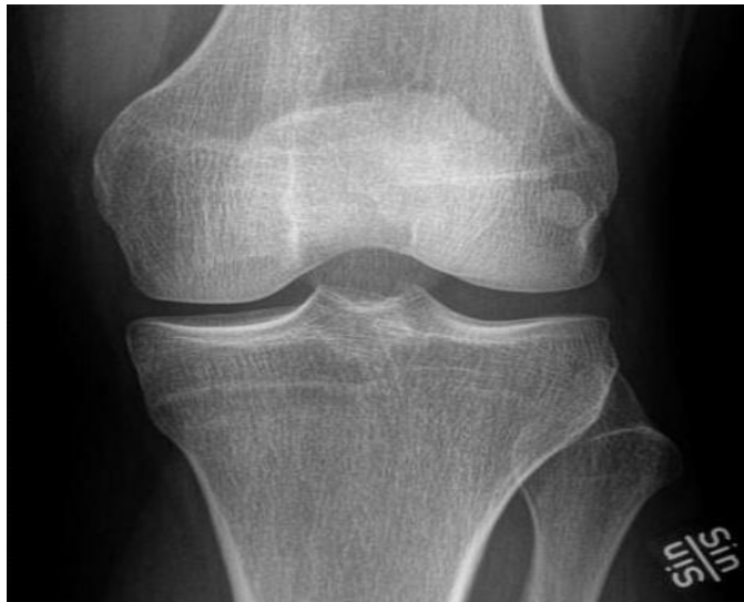
Antalet remisser för slätröntgen knä år 2010-2013 var i snitt 87 per år (99 undersökningar). År 2014 skrevs totalt 66 remisser (75 undersökningar) och år 2015 t.o.m. 24 november var 41 remisser (47 undersökningar) skrivna.