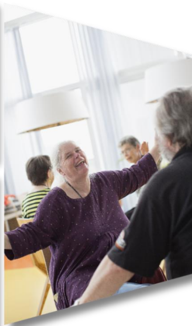
Stöd för kropp och själ